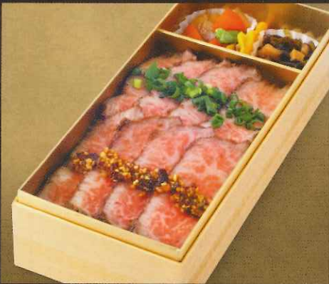
上州牛 ステーキ弁当(特上) 2,700円