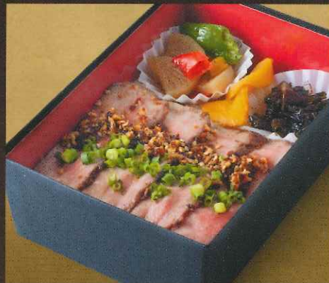
上州牛 ステーキ弁当(上) 1,620円